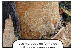
Les marques en forme de « S » sont causées par l'agrile du frêne.