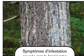
Symptômes d'infestation causée par le longicorne brun de l'épinette.