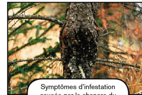
Symptômes d'infestation causée par le chancres du mélèze d'Europe.