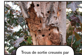
Trous de sortie creusés par le longicorne asiatique.