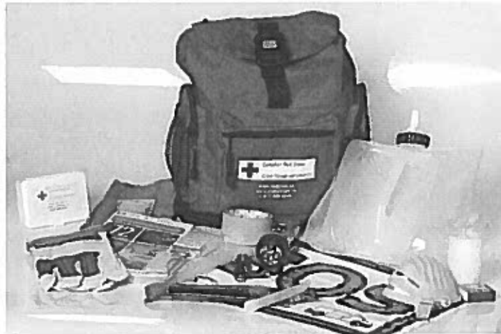
Trousse de la Croix-Rouge canadienne

Les 7 premiers articles vous permettront, à vous et à votre famille, de subsister pendant les 3 premiers jours d'une situation d'urgence, le temps qu'arrivent les secours ou que les services essentiels soient rétablis.